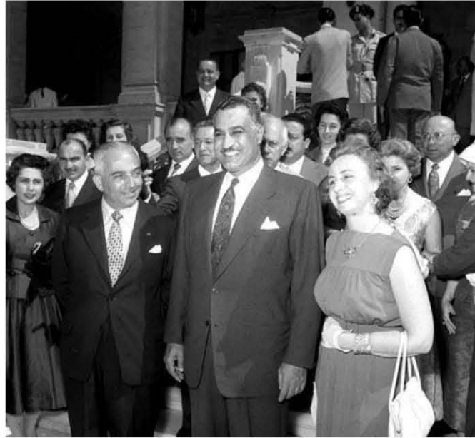
استقبال وفد برلماني برازيلي ١٩٥٧/١٠/٢

لعرض وجهات نظر هذه الدول بخصوص قنال السويس؟ وسيجتمع مجلس الوزراء غدا للبحث في هذا الموضوع.